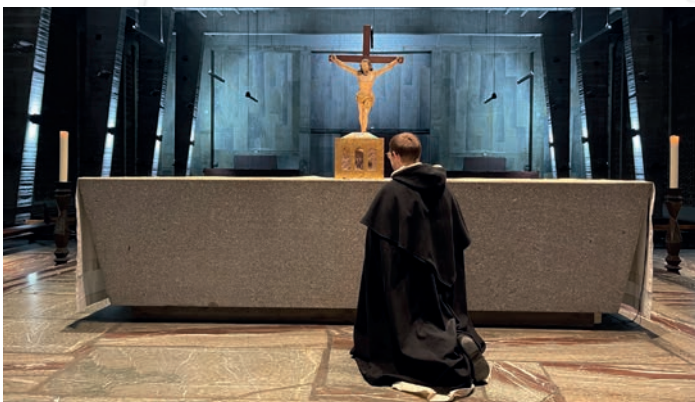
Saint Thomas d'Aquin à La Rochelle